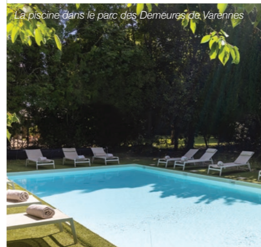
La piscine dans le parc des Demeures de Varennes