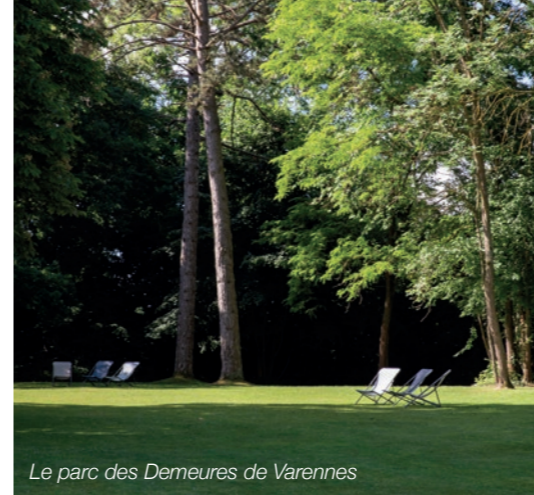
Le parc des Demeures de Varennes