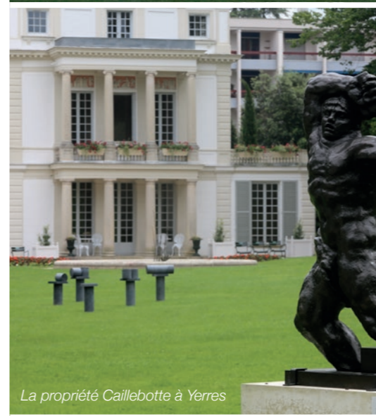
La propriété Caillebotte à Yerres